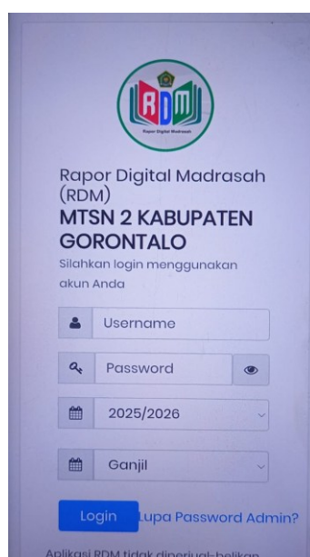
Gambar 1 Aplikasi Rapor Digital Madrasah