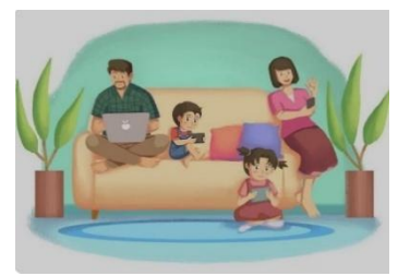
Gambar 1 Pola Asuh Permisif