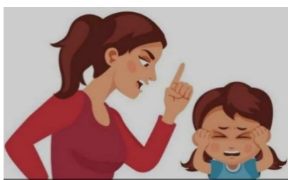
Gambar 3 Pola Asuh Otoriter

Setiap pola asuh yang ditanamkan dan dibiasakan dari kecil akan berpengaruh ketika beranjak dewasa. Lingkungan menjadi pengaruh utama yang paling menempati pengaruh paling besar meskipun berada dalam lingkungan pendidikan atau masyarakat awam sekalipun. Dalam hal ini orang tua memiliki kendali dan peran besar atas keterlibatannya mengasuh anak, hasilnya akan tentu berbeda dengan anak yang tidak memiliki peran orang tua yang berimplikasi pada karakter anak. Berikut ilustrasinya dalam bentuk gambar: