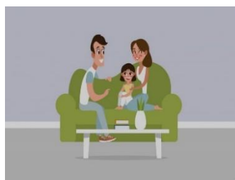
Gambar 2 Pola Asuh Demokratis